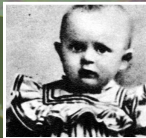
Karol Wojtyła / św. Jan Paweł II